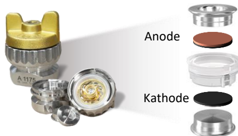
Abbildung 1: Bisheriger Experimentalzellaufbau für Flüssigelektrolytsysteme

Aktuelle Lithium-Ionen-Batterien (LIB) sind durch ihre Zyklenstabilität und hohem Wirkungsgrad vielen weiteren elektrochemischen Speichertechnologien überlegen. Eine Möglichkeit die Energie- und Leistungsdichte sowie den Betriebstemperaturbereich und die Sicherheit in zukünftigen Batterietechnologien zu erhöhen bietet die Verwendung eines Festelektrolytsystems in Kombination mit Lithium-Metall-Anoden. Im Bereich der experimentellen Charakterisierung ermöglichen Experimentalzellen die Untersuchung des Verhaltens der Gesamtzelle sowie auch das der einzelnen Elektroden unter definierten Belastungsfällen und Randbedingungen. Im Rahmen dieser Arbeit am Institut für Thermische Verfahrenstechnik (TVT) soll ein Konzept zur Charakterisierung von Feststoff-Batteriesystemen mit Hilfe von Experimentalzellen entwickelt werden. Die vorhandene Methodik für Flüssigelektrolytsysteme dient hierbei als Ausgangsbasis der Entwicklung.